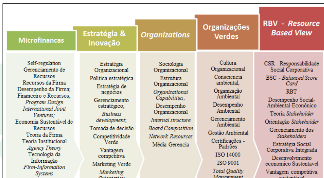
Figura 3 - Mapeamento Temas e Sub-temas para uma Agenda Futura de Pesquisas

A Figura 3 faz o resumo destas temáticas para agenda de trabalhos futuros.