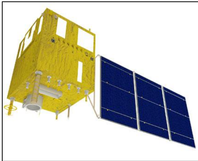
Figura 1 - Ilustração do CBERS-2B.