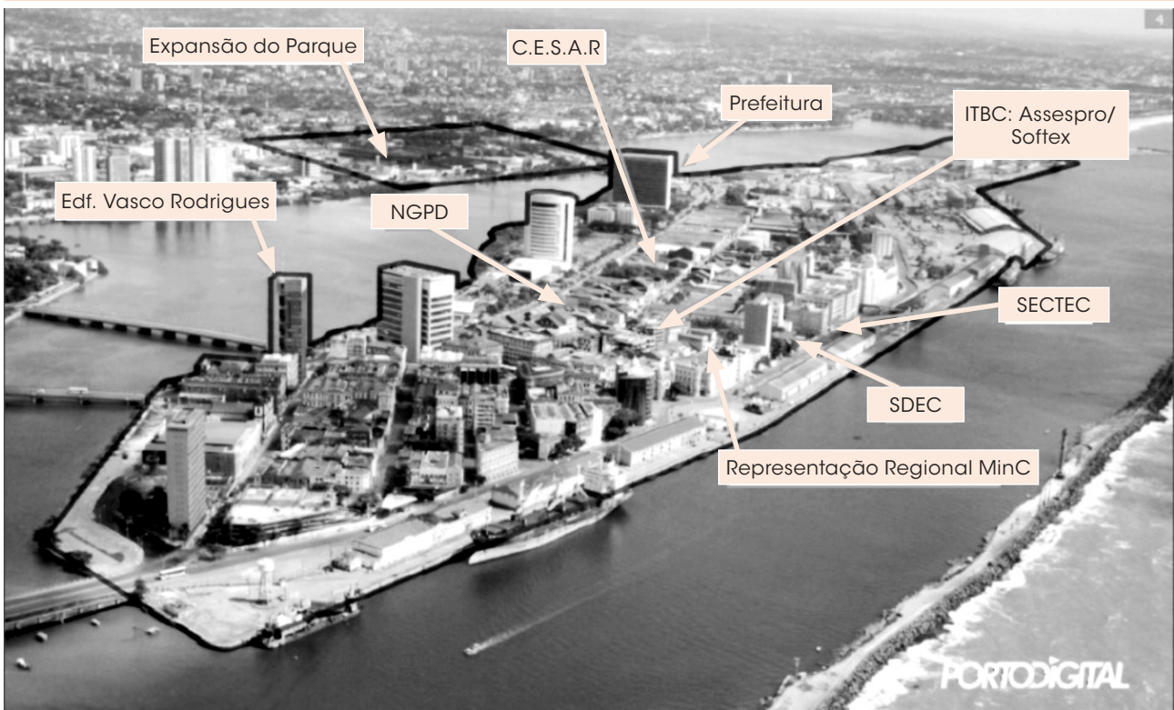
Figura 2: Área de abrangência e governança do Porto Digital