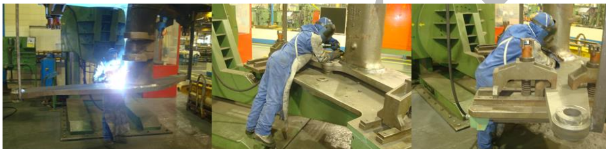
Figura 3 – Posição do soldador durante o processo de soldagem manual

A partir do uso da ferramenta SFMEA, identificou-se que o processo de soldagem manual da peça escolhida possuía risco médio, já que a posição de soldagem do soldador não era adequada, a atividade era repetitiva e, em alguns momentos, o soldador precisa se posicionar por debaixo da peça. A Figura 3 mostra a posição do soldador para a operação de soldagem manual: